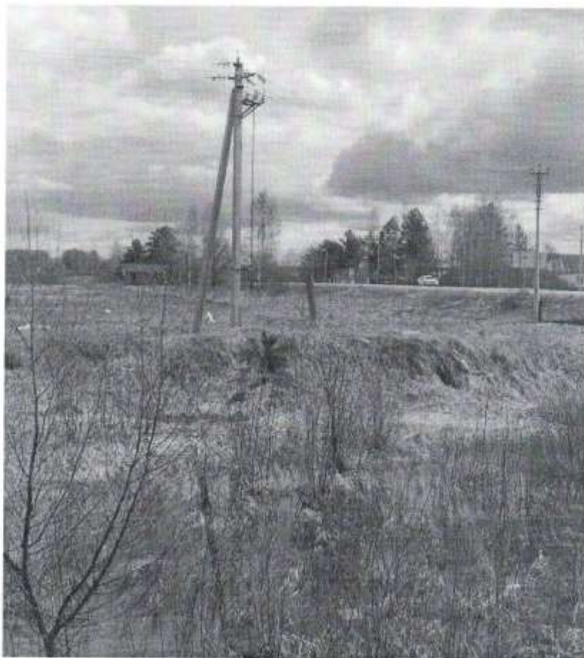
Земельный участок 50:01:0050122:24 МО Талдомский район с. Новоникольское.